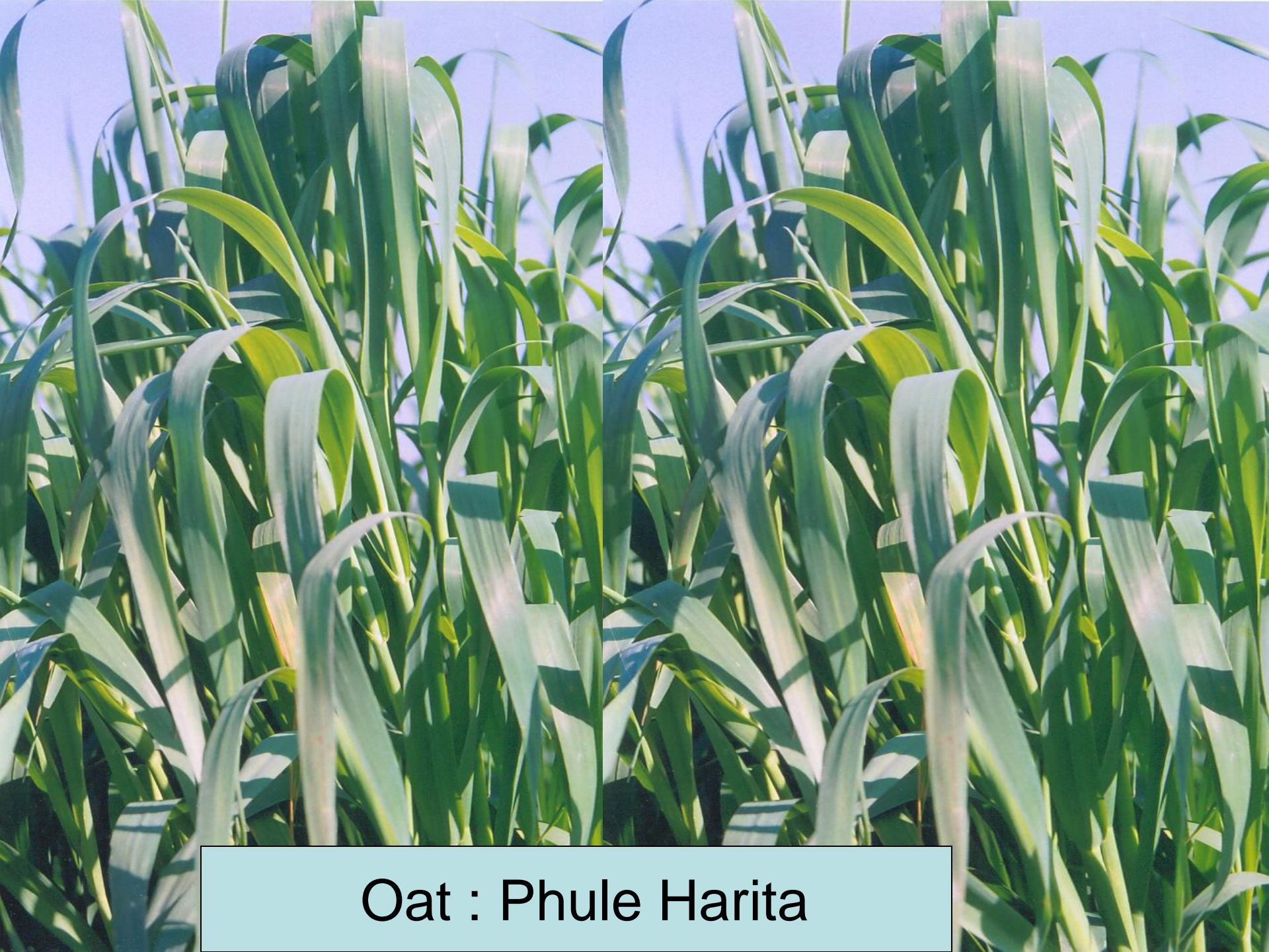
Oat : Phule Harita