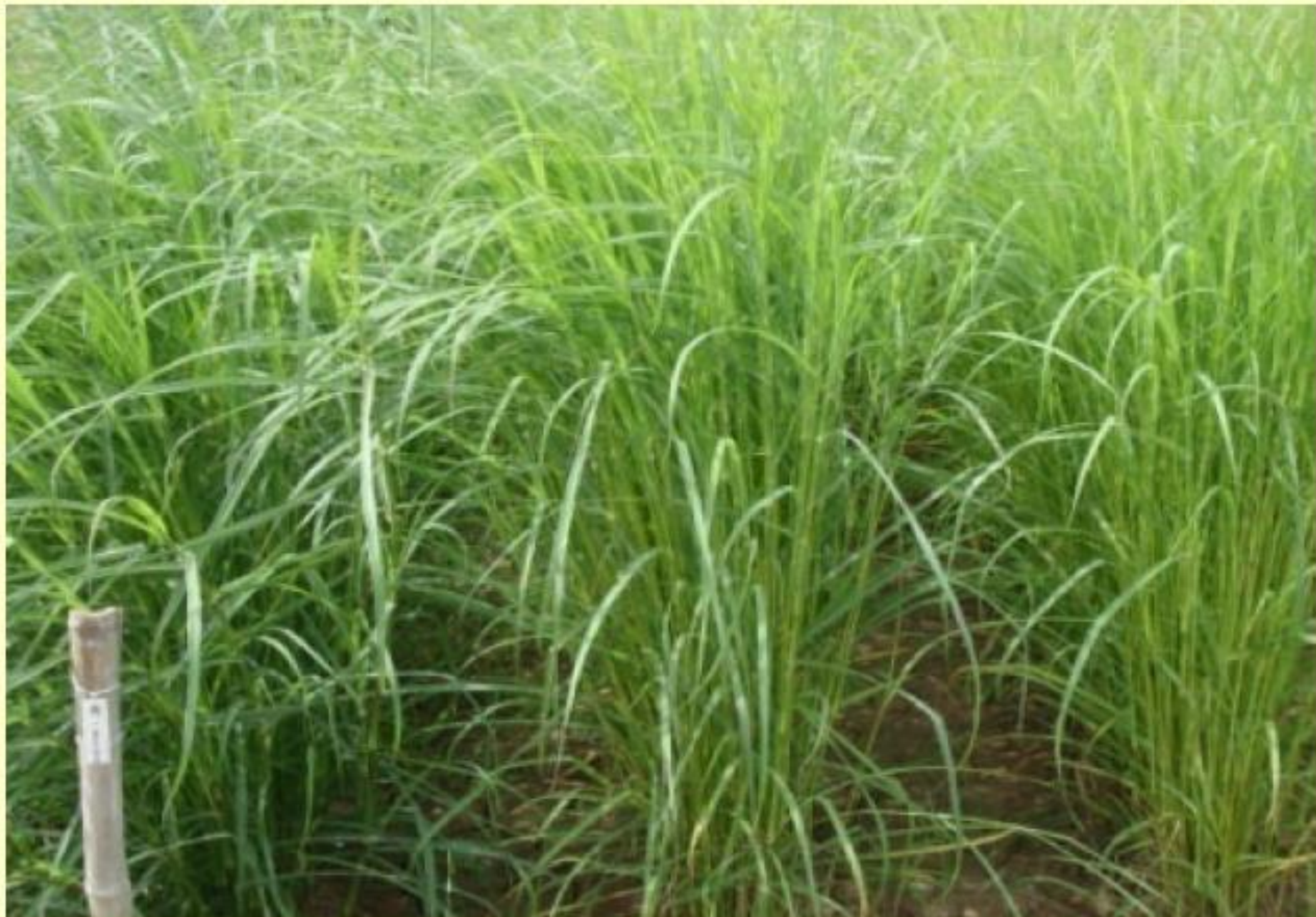
फुले मारवेल - ०६-४०