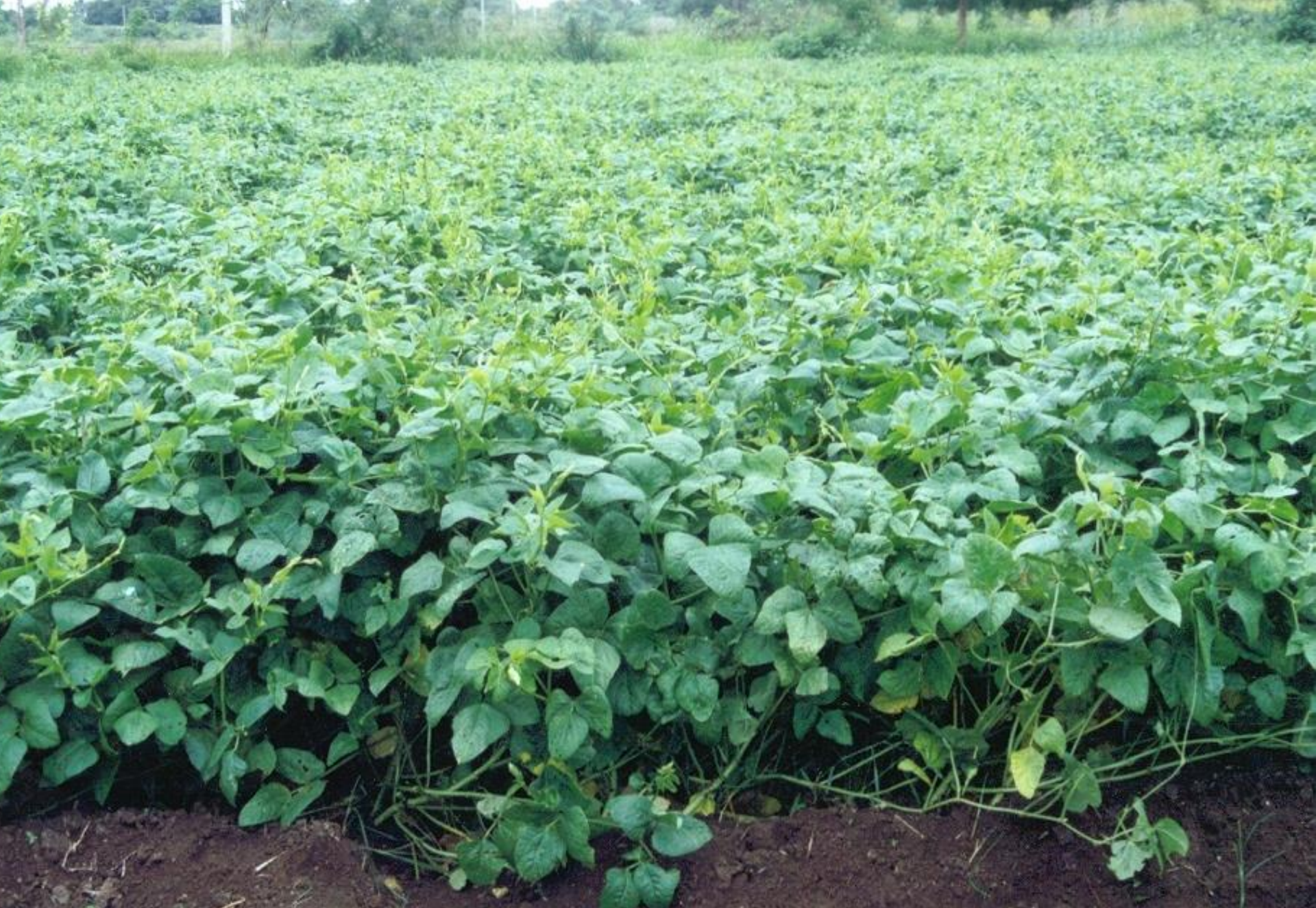
Forage cowpea- Shweta