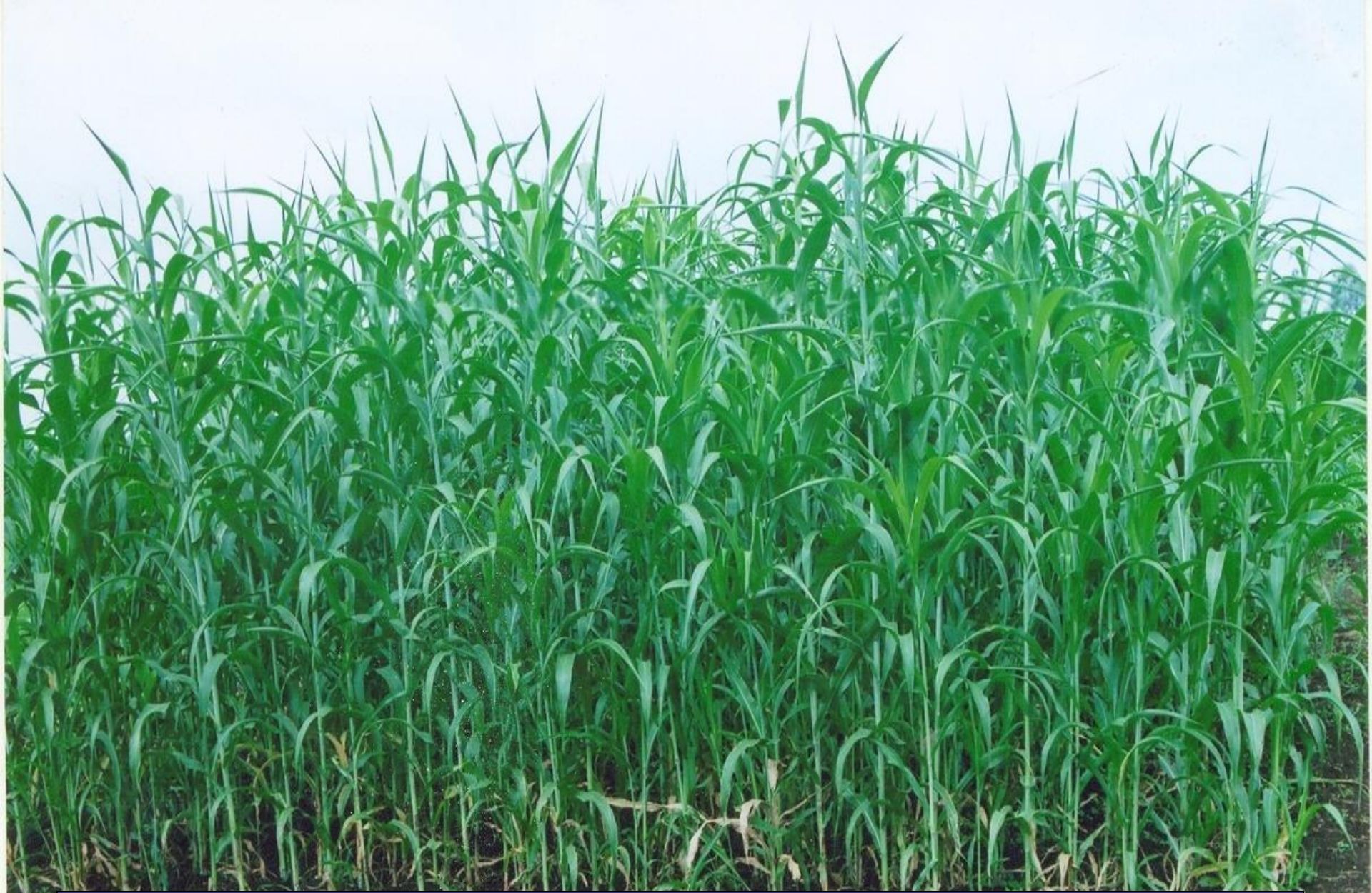
Forage Sorghum- Ruchira