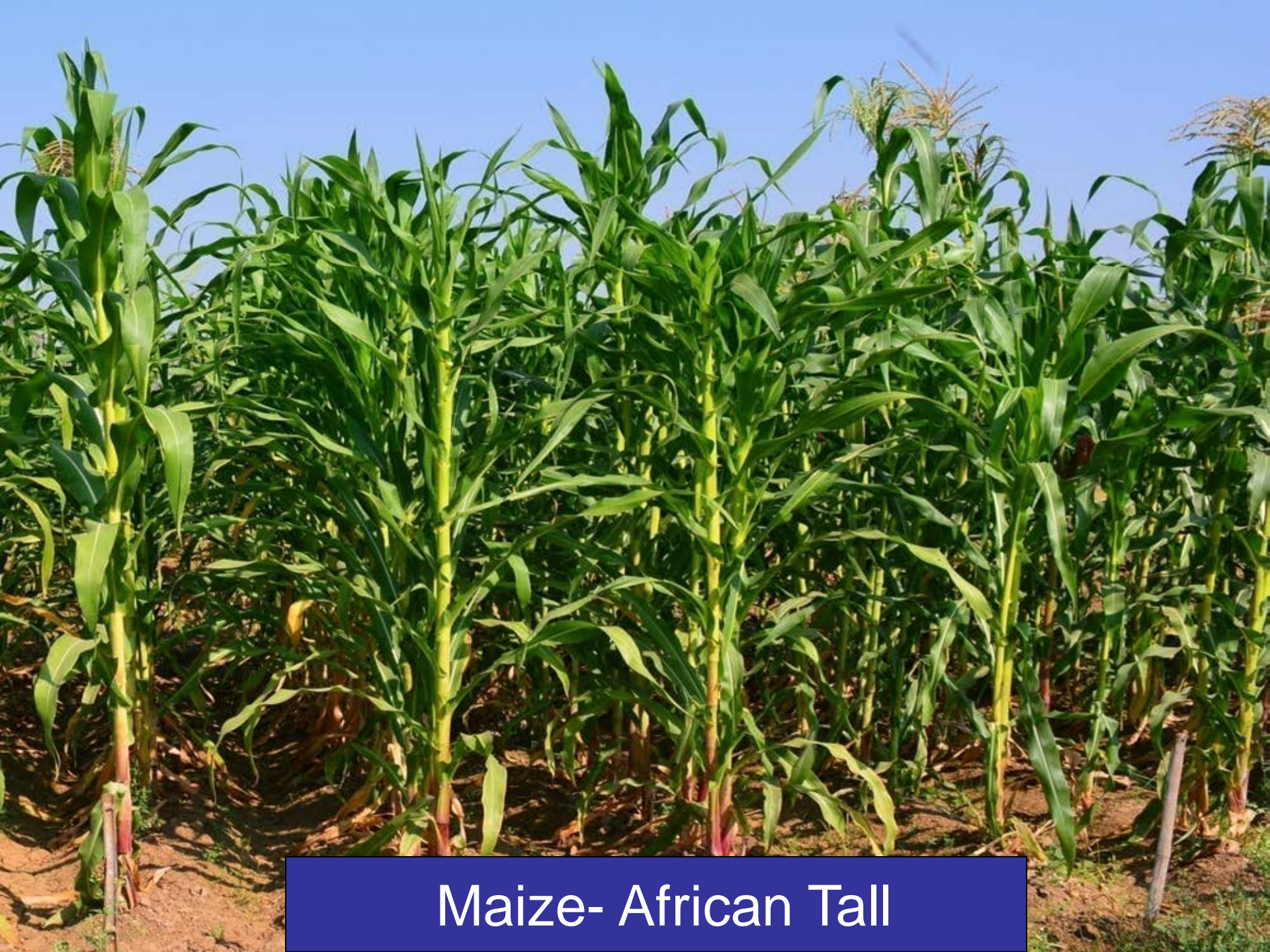
Maize- African Tall