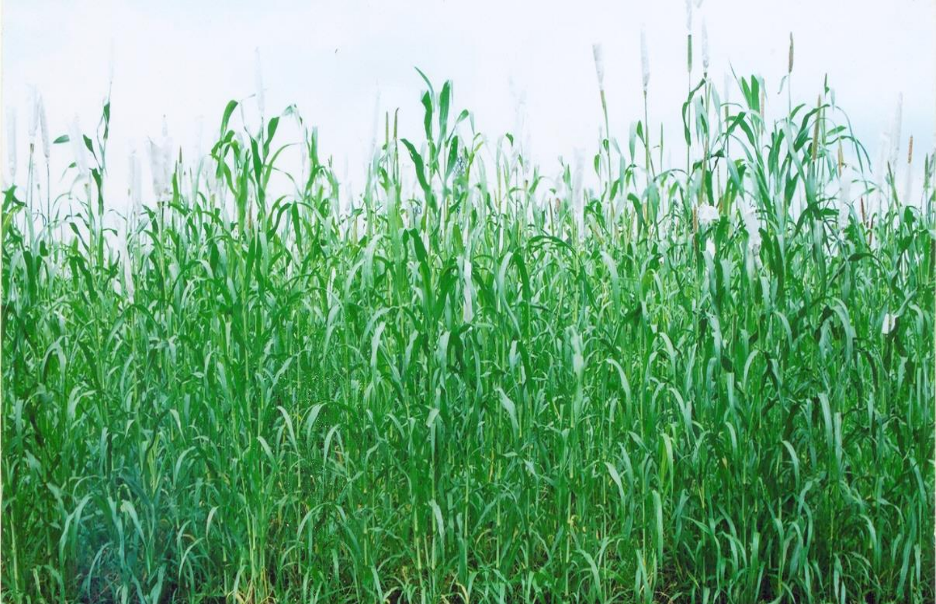
Forage bajra- Giant bajra