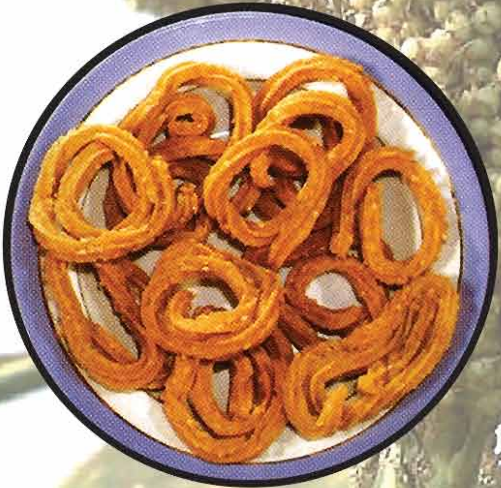
चकली / Chakali