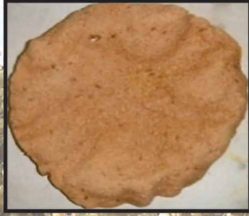
पापड / Papad