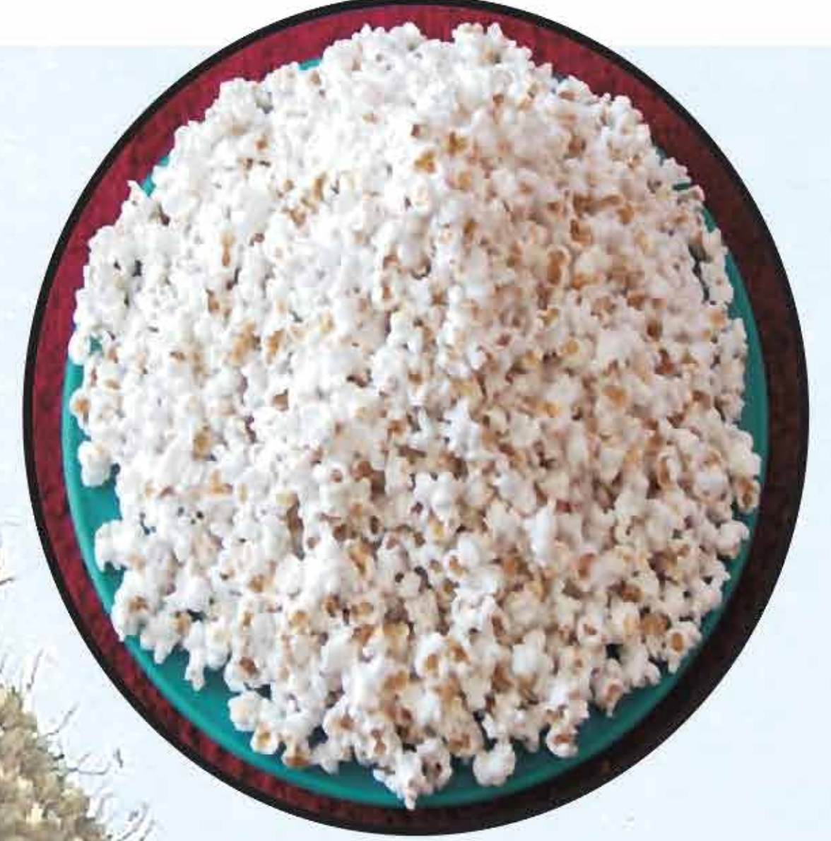
लाह्या / Pop