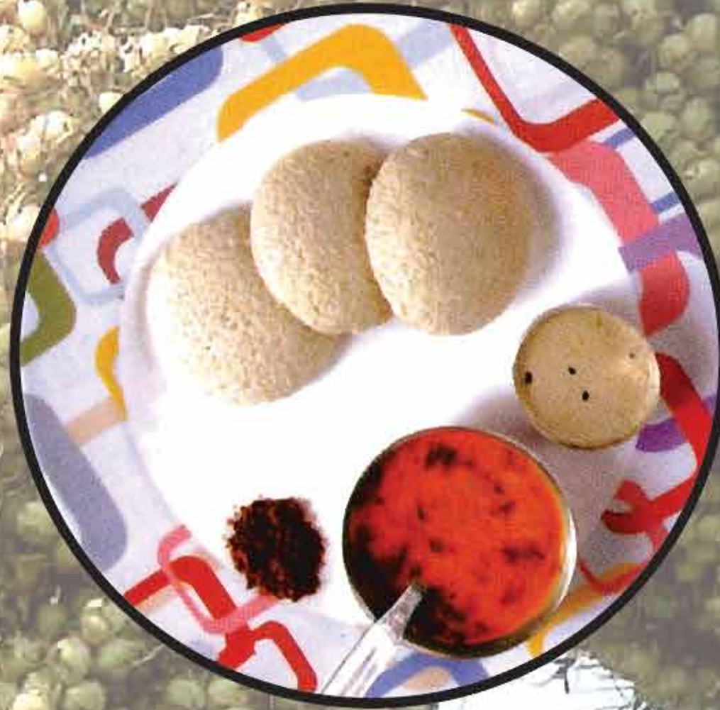
इडली / Idli