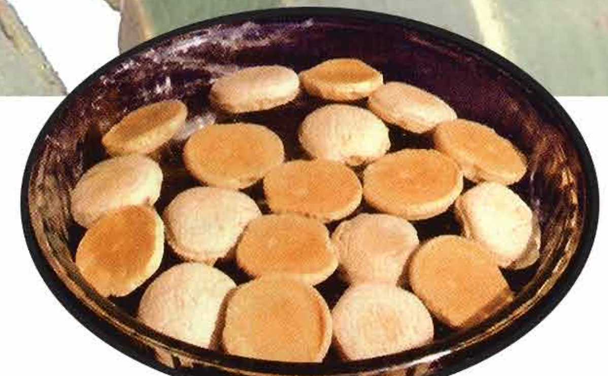
नानकटाई / Nankatai