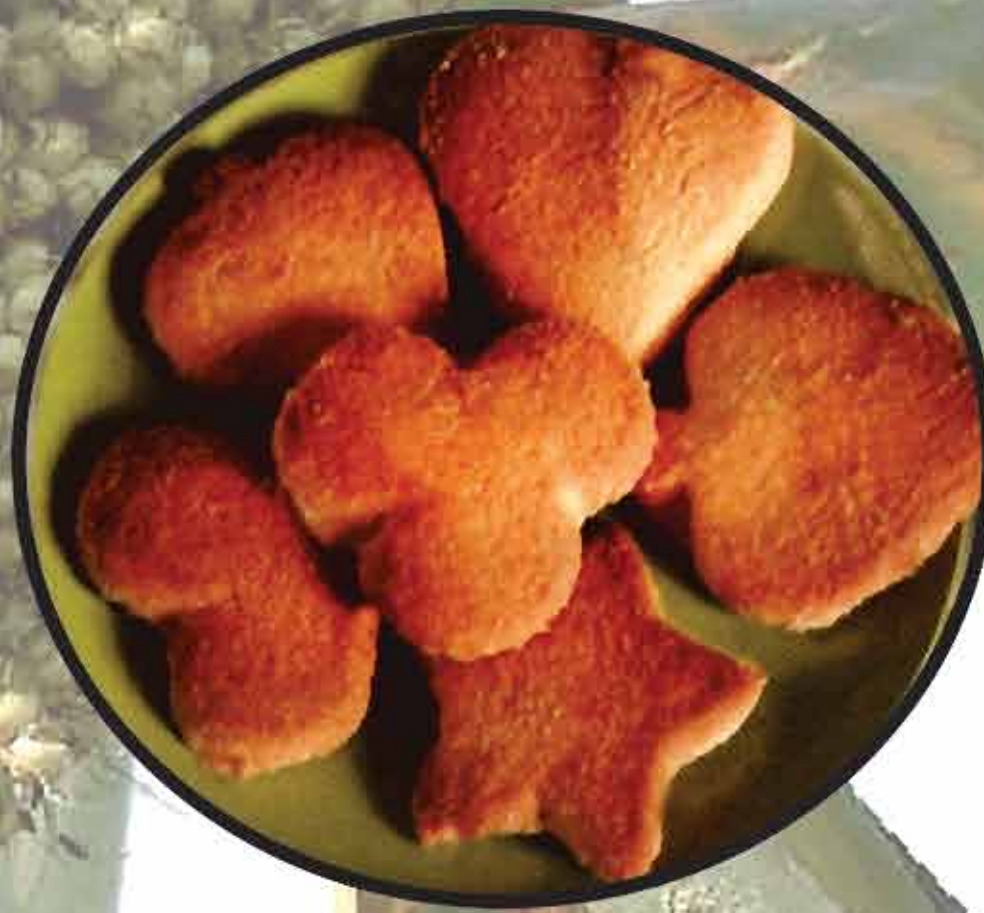
बिस्कीट / Biscuit