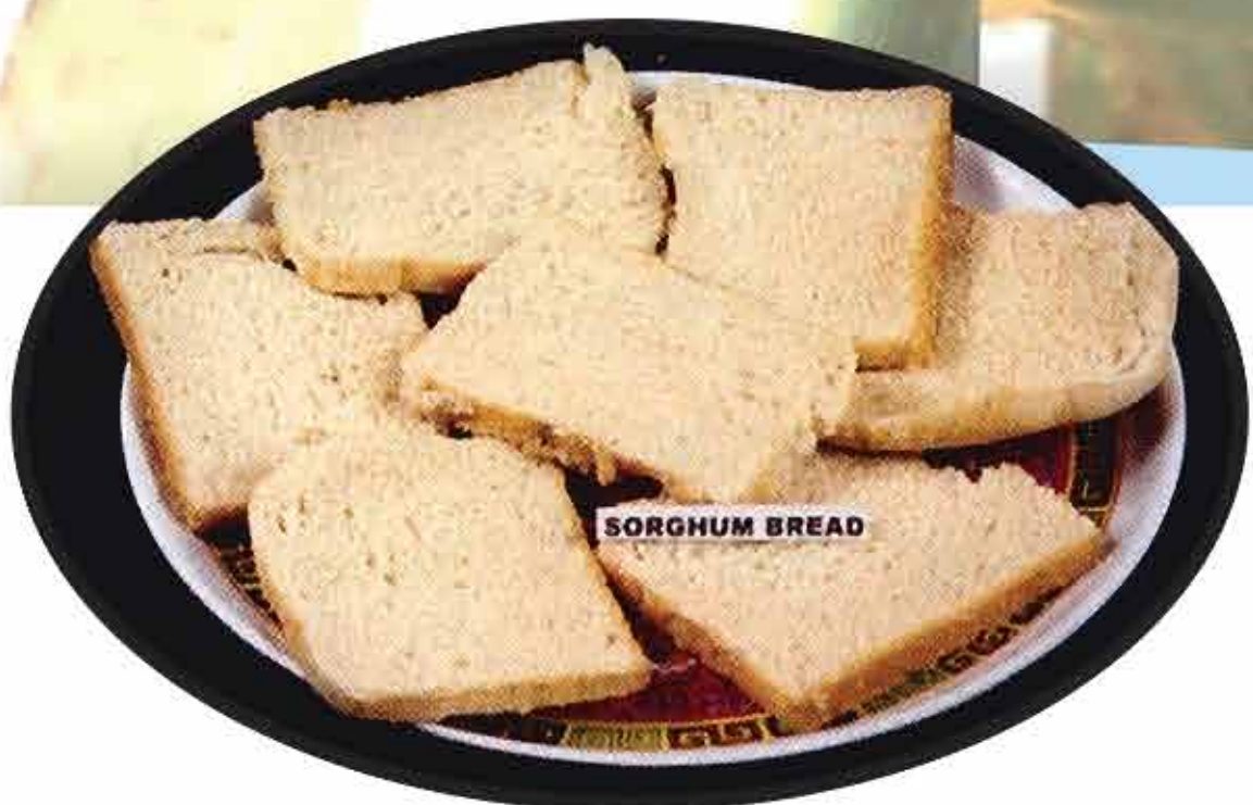
ब्रेड / Bread