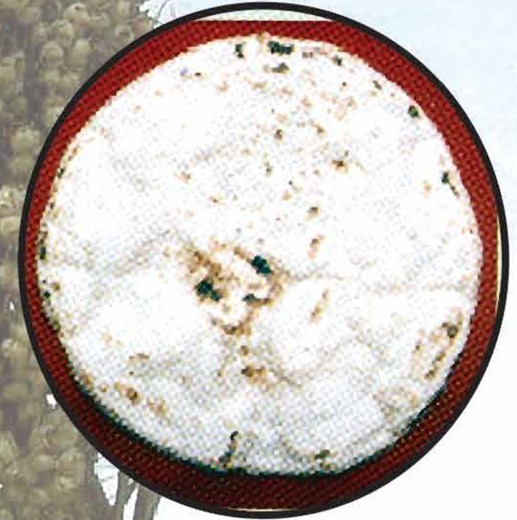
भाकरी / Roti