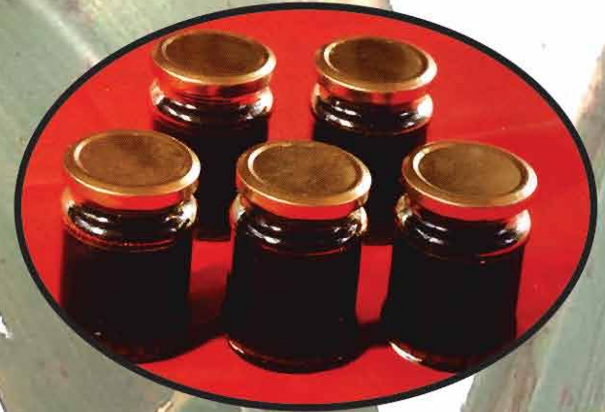
काकवी / Syrup