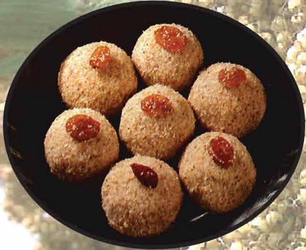
लाडू / Ladu