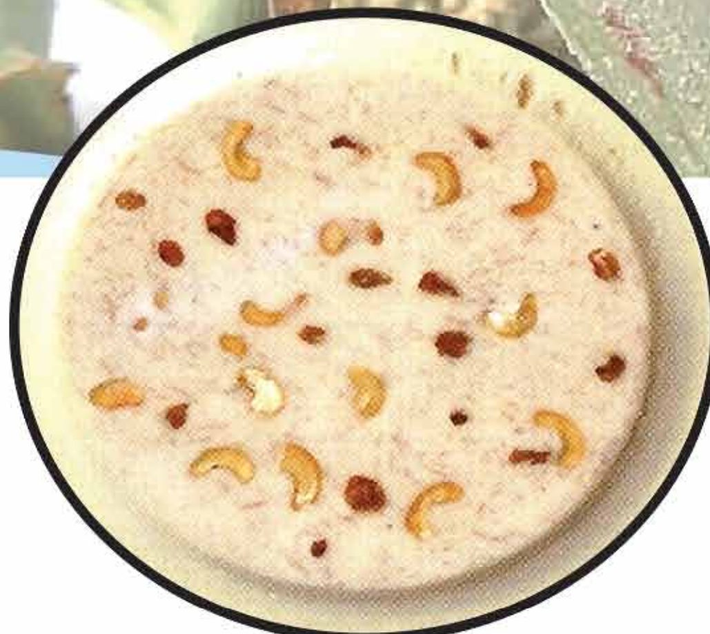
खीर / Khir