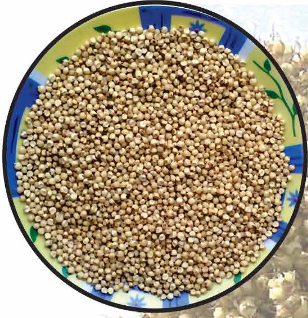
हुरडा / Hurda